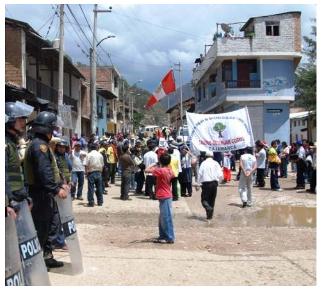
Se tiene que definir bien a quien acudir para presentar una demanda ciudadana

Como se ha visto, este artículo no está dirigido a especialistas en conflictos sociales, sino es una explicación sencilla dirigida a cualquier ciudadano que forme parte de algún colectivo social que tiene la necesidad de elevar sus demandas para ser resueltas por una autoridad estatal, los mismos que deberán hacerse la pregunta ¿a quién y dónde presento mi reclamo?