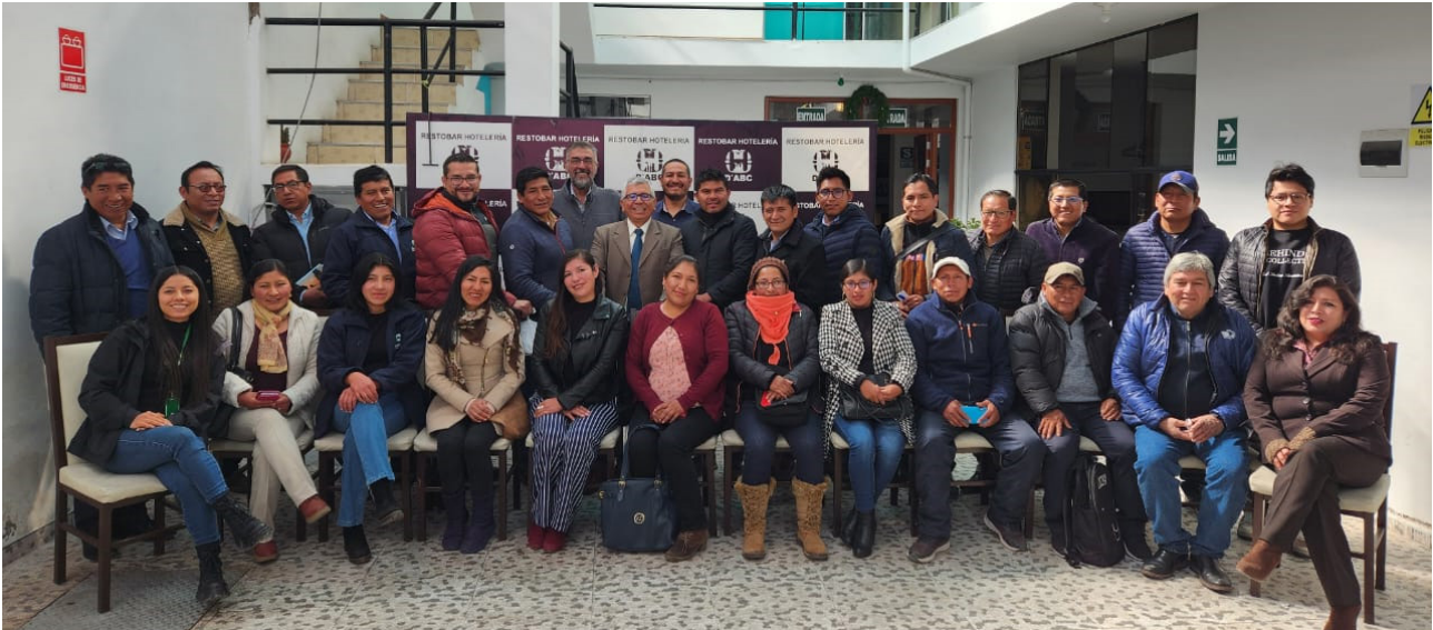
El desayuno empresarial organizado por Solidaritas Perú sentó las bases para la formación de la Cámara de Comercio de Espinar.

La recién formada Cámara de Comercio de Espinar coadyuvará en el desarrollo de la provincia cusqueña que tiene gran potencial turístico, alta producción pecuaria, de cañihua y otros cereales, además de gran demanda comercial.