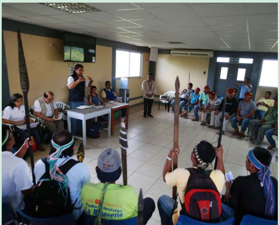
El diálogo social puede verse tanto como un fin y como un medio.

Para abordar eficazmente los conflictos sociales, es necesario un retorno a los principios de la ciudadanía y la dignidad. Los acuerdos y políticas deben ser diseñados con la consideración primordial de preservar la dignidad de todas las personas, reconociendo sus aspiraciones legítimas. Ignorar estas demandas conlleva el riesgo de socavar la cohesión social y la confianza en las instituciones, lo que puede dar lugar a consecuencias impredecibles y, en última instancia, perjudiciales para la comunidad en su conjunto.