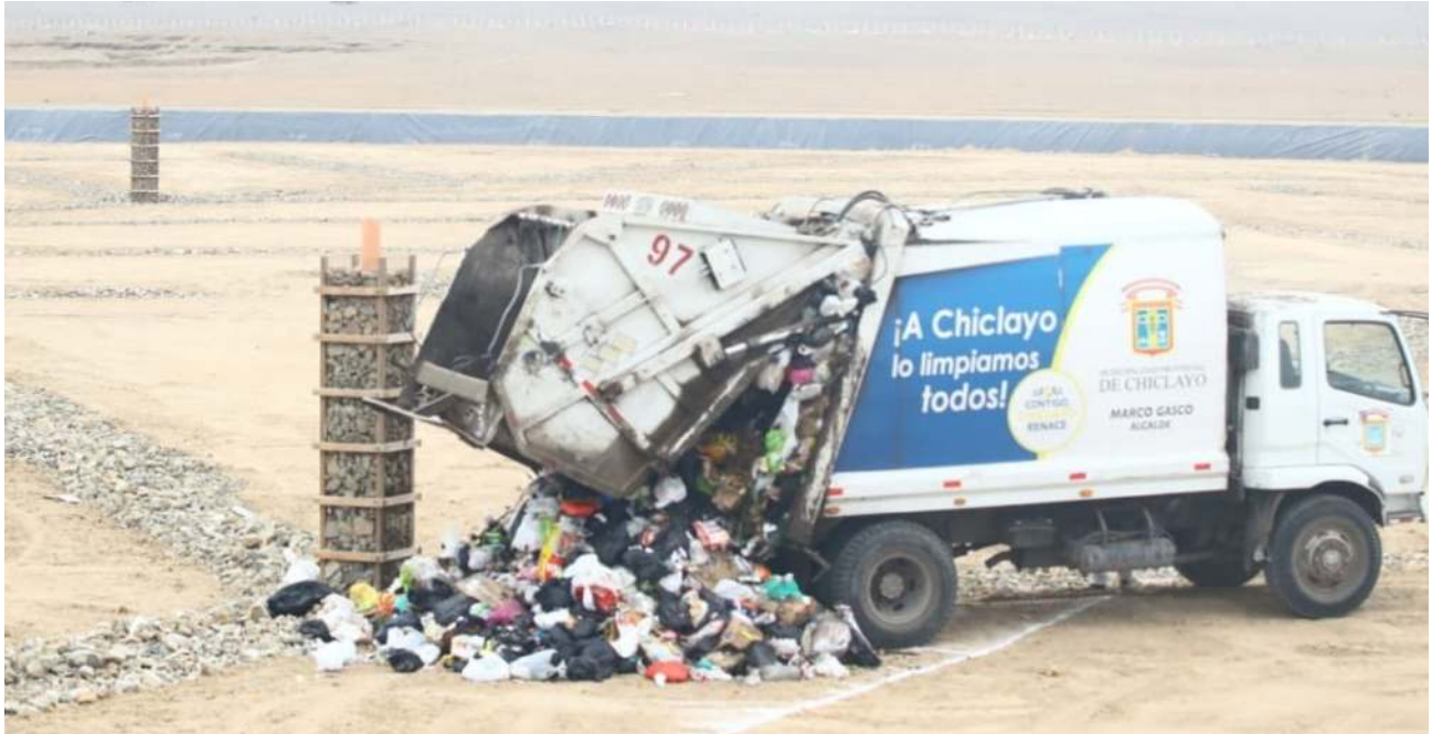
Las soluciones a este problema deben venir de todos los niveles de gobierno y la propia ciudadanía.

Según la OEFA, en el país existen 1813 botaderos de residuos sólidos, lo que es alarmante y debe llamarnos a actuar desde nuestra posición como ciudadanos o autoridades.