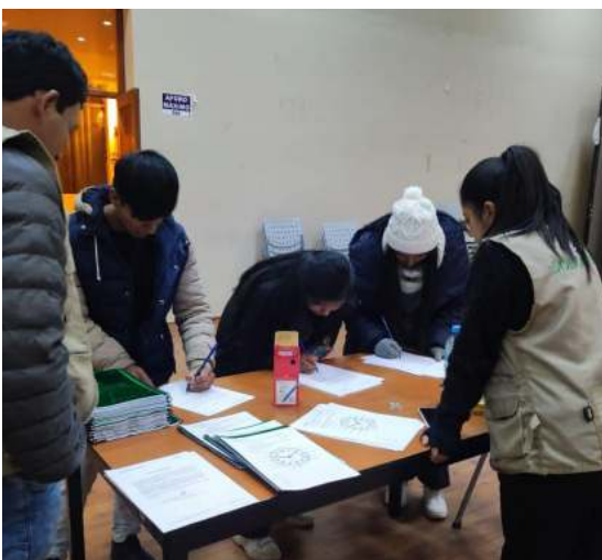
Beneficiados del taller “Desarrollo de mi entendimiento”.

El capital semilla otorgado por Solidaritas Perú permitió la compra de equipos, insumos y materiales priorizados para la puesta en marcha de estos emprendimientos espinarenses.