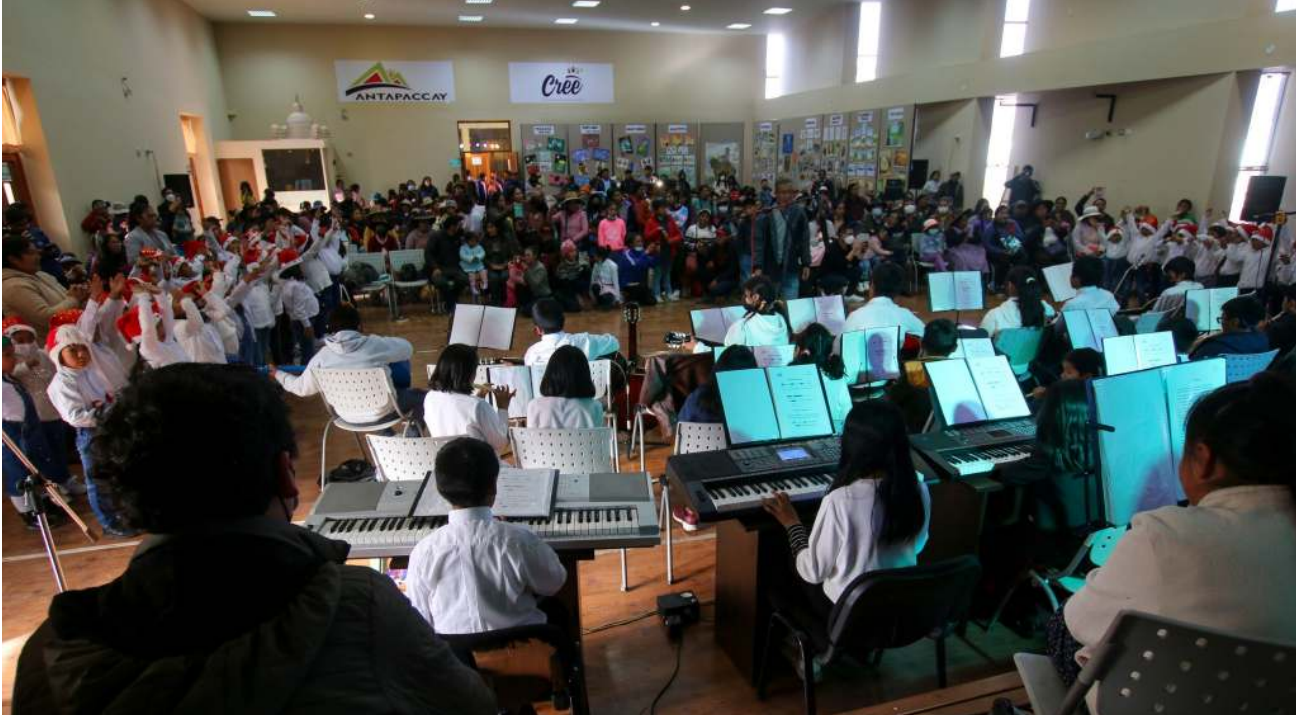
La Central de Recursos Educativos de Espinar complementa la educación de los estudiantes mediante la cultura y el arte.

La Central de Recursos Educativos de Espinar (CREE), es un espacio vanguardista en el que estudiantes y docentes crean entornos de aprendizaje de alto impacto, complementando la educación básica regular.