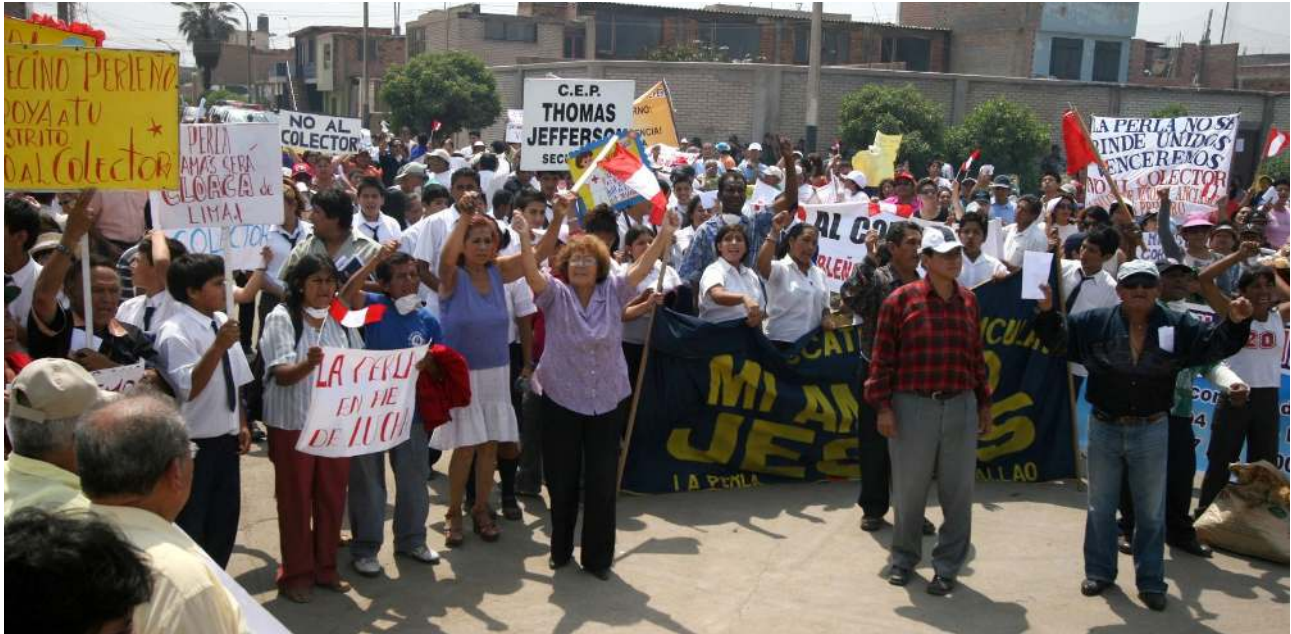
Los conflictos sociales deben ser tratados por las autoridades correspondientes.

En los últimos diez años, la necesidad de gestionar los conflictos sociales ha llevado a la necesidad de crear oficinas especializadas en la mayoría de los ministerios estatales y, una secretaría especializada en la Presidencia del Consejo de Ministros bajo la conducción del viceministerio de Gobernanza Territorial, que buscan de alguna manera prevenir, gestionar y hacer seguimiento a los conflictos sociales.