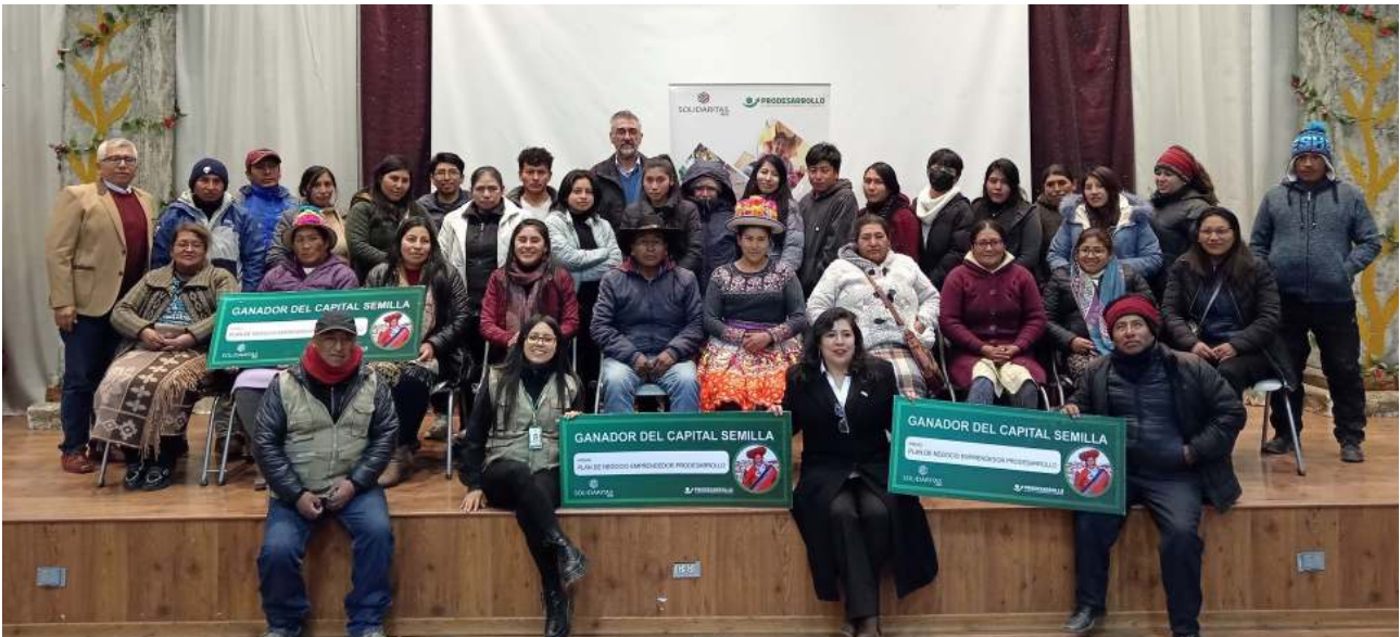
Clausura del taller basado en la metodología IMESUN, desarrollado por PRODESARROLLO.