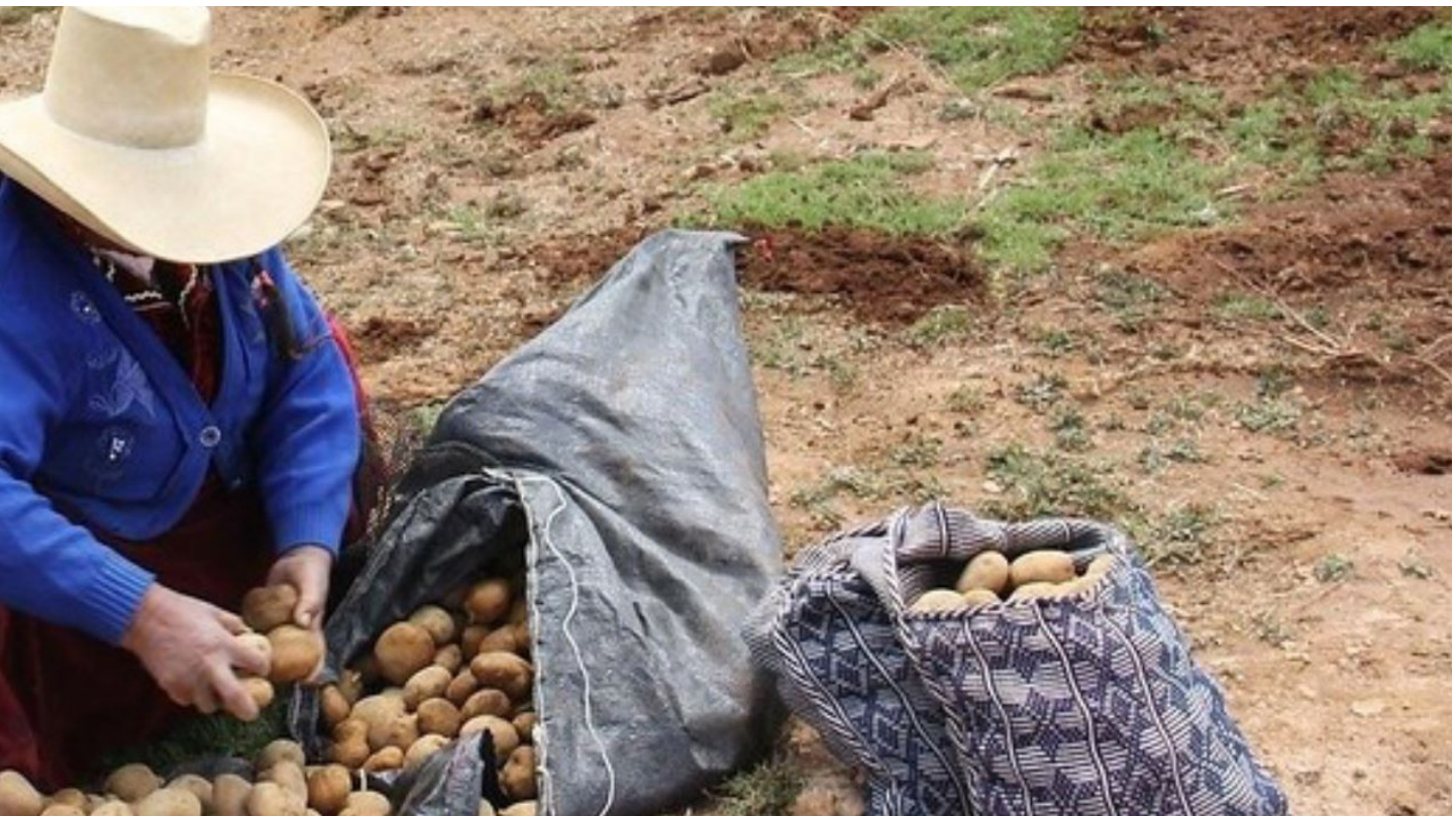
Los gobiernos locales también deben ser protagonistas en el cierre de brechas sociales dentro de las regiones que son parte del Corredor Vial Sur.

sido escalado para tomar valores en el rango de 0 a 1: Mayores Carencias (cercano a 1) y Menores carencias (cercano a 0) en ese índice Espinar es el distrito con menos carencias versus Livitaca que tiene las mayores carencias