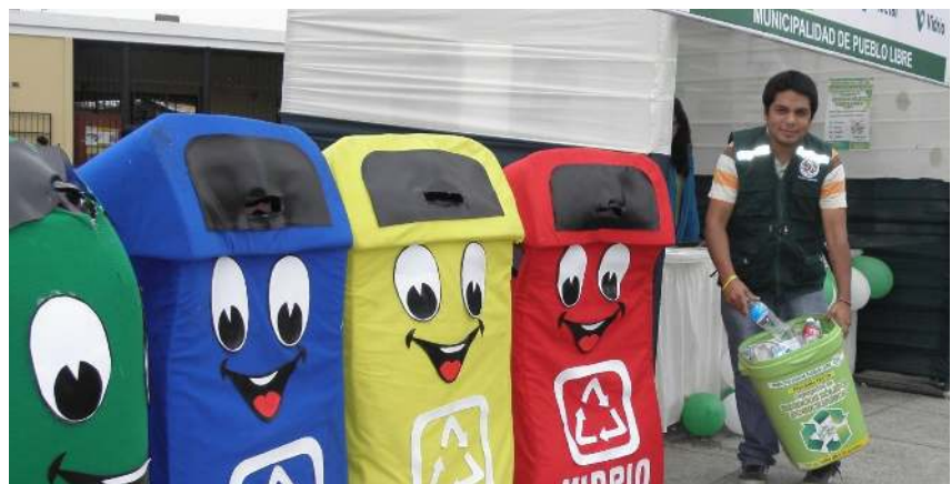
Este problema se ha intensificado recientemente, por lo que se la ha empezado a prestar especial atención.

Es por ello que, como país, debemos tener en cuenta las acciones que debemos realizar tanto desde nuestro deber como ciudadanos, realizando una correcta segregación y disposición de los residuos sólidos, así como, aquellos entes gestores de los residuos, dado que estos son los encargados de desarrollar las acciones necesarias para poder promover dentro de nuestro país una mejor cultura de gestión, al igual que deben desarrollar la infraestructura adecuada para una debida valorización de los residuos sólidos, permitiendo con ello que se gesten una correcta economía circular en nuestro país.