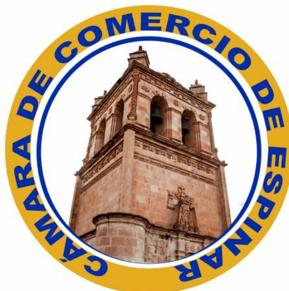
Los fundadores de la Cámara de Comercio de Espinar eligieron, recientemente, su primer Consejo Directivo.